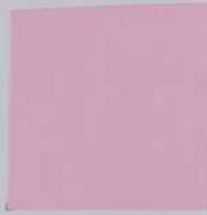
MO2 Baby Pink