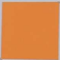
*MO5 Golden Sun