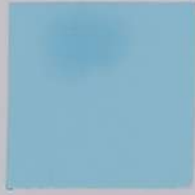
MO3 Princess Blue