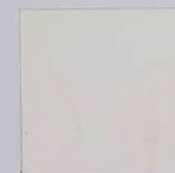
M12 Super White